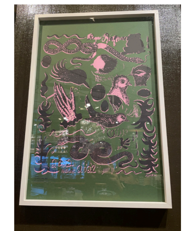
Green Room Screentryck 35 ggr 50 cm pris vid förfrågan