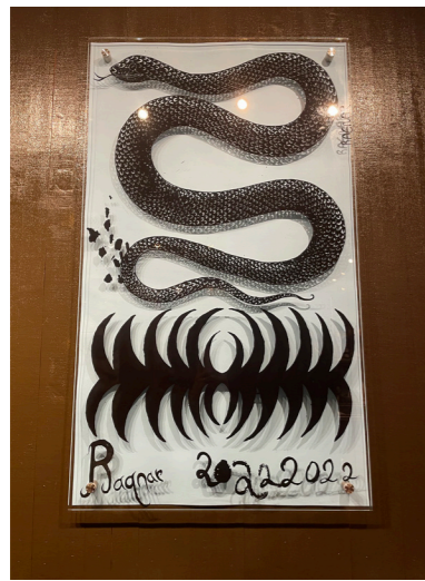
Untitled/ collage works on glass 1 härdat glas ed. 1/1 70 ggr 120 cm pris vid förfrågan