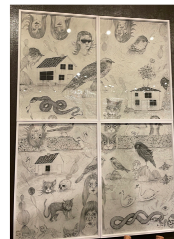
Utsikten Artprint 1 verk 4 delar 100 ggr 140 cm upplaga 1 av 1 pris vid förfrågan