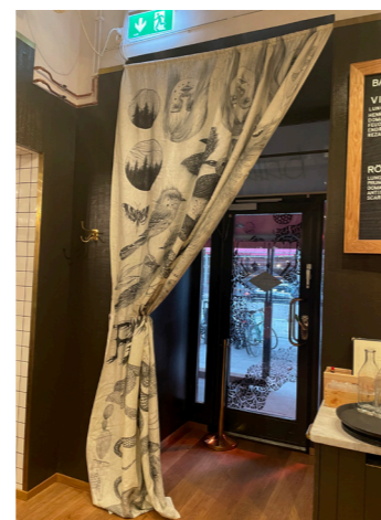
Studie i grått Textilt verk, 100 % Lin 210 ggr 324 cm pris vid förfrågan