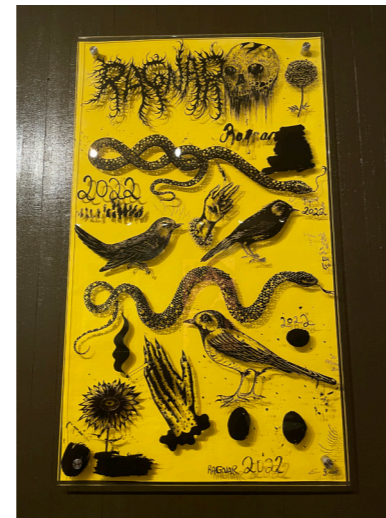
untitled/ collage works on glass 5 härdat glas ed. 1/1 70 ggr 120 cm pris vid förfrågan