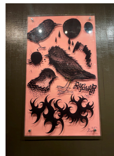
Untitled/ collage works on glass 3 härdat glas ed. 1/1 70 ggr 120 cm pris vid förfrågan