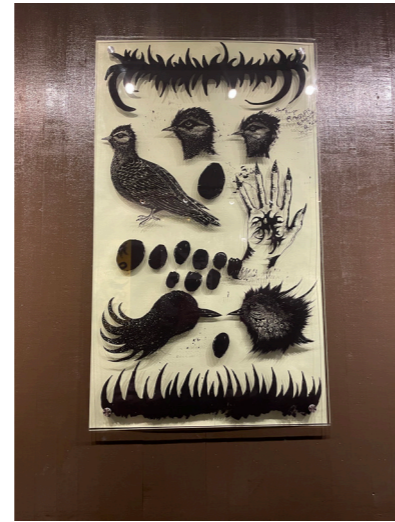
Untitled/ collage works on glass 2 härdat glas ed. 1/1 70 ggr 120 cm pris vid förfrågan