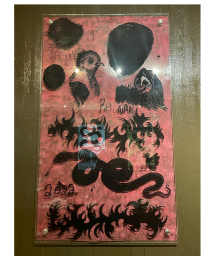
untitled/ collage works on glass 7 härdat glas ed. 1/1 70 ggr 120 cm pris vid förfrågan