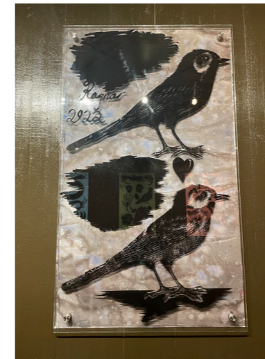
untitled/ collage works on glass 6 härdat glas ed. 1/1 70 ggr 120 cm pris vid förfrågan