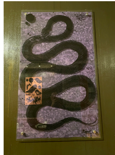
untitled/ collage works on glass 4 härdat glas ed. 1/1 70 ggr 120 cm pris vid förfrågan