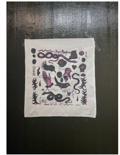
Servett 5 olika motiv